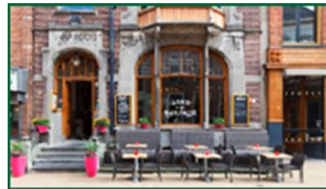
Ons etablissement 'Kokanje'