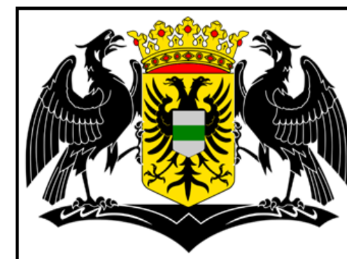
Wapen van de stad Groningen

De afdeling Groningen munt uit door de combinatie van Vlaamse levensvreugde en Groningse degelijkheid. Wij zien haar als een van de parels in de kroon van de orde.