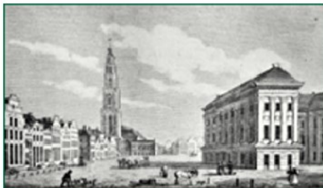
Groningen, 19e eeuw